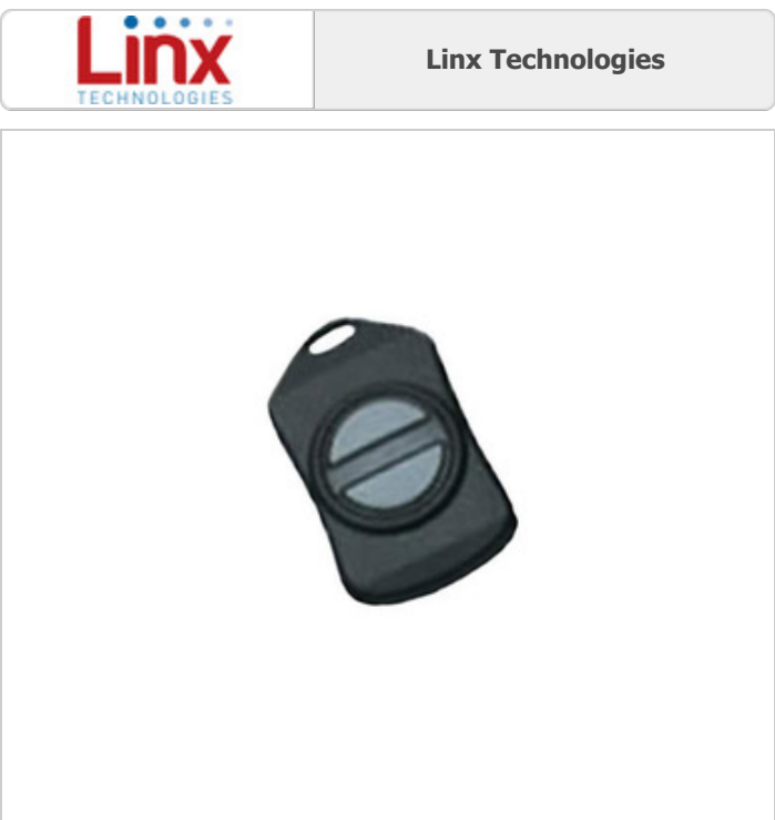
Hình ảnh có thể là đại diện. Xem thông số kỹ thuật để biết chi tiết sản phẩm.